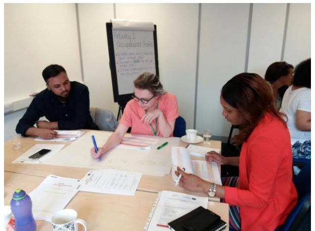
Multiplier event στο Λονδίνο, 23 η Μάη 2018