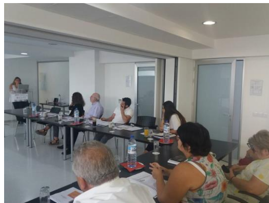
To Multiplier event στη Λευκωσία, 27 η Σεπτεμβρίου

μελλοντική εργασία σε σχέση με την επίσημη διαπίστευση του προγράμματος σπουδών Job Broker, π.χ. Πανεπιστήμια για το ECTS και τα ιδρύματα επαγγελματικής εκπαίδευσης και κατάρτισης για το ECVET κ.λπ. Η Abif είχε επίσης λάβει υπόψη το ISO 17024 (Γενικές απαιτήσεις για φορείς πιστοποίησης προσώπων) σχετικά με τη διαπίστευση ως σαφή εναλλακτική λύση, δεδομένων των διεθνών συνθηκών και της δυνατότητας μεταφοράς του ISO.